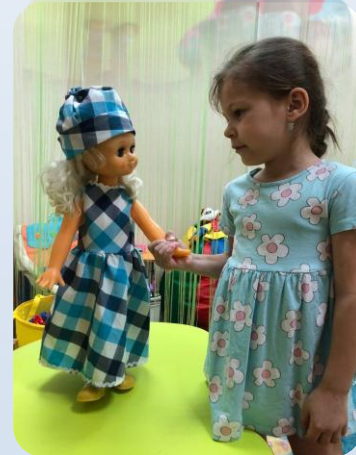
Наряды для куклы сшитые Кирой и её мамой