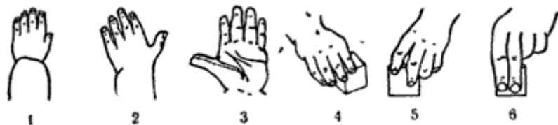
Рис. 3. Этапы развития функций кисти руки ребенка: 1 - положение кисти в 16 недель, 2 и 3 - в 56 недель, 4 - в 60 недель, 5 - в 3 года, 6 - взрослый.

На рис. 3 показано, как совершенствуются движения пальцев рук в процессе развития ребенка. Особое значение имеет период, когда начинается противопоставление большого пальца другим - с этого времени и движения остальных пальцев становятся более свободными.